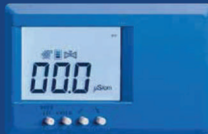
Monitorização Água Tipo II

Manutenção fácil e rápida, graças ao seu sistema de cartuchos intercambiáveis, mediante conexões rápidas.